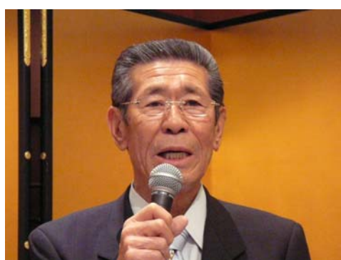
〔主催者挨拶の宮嶋会長〕