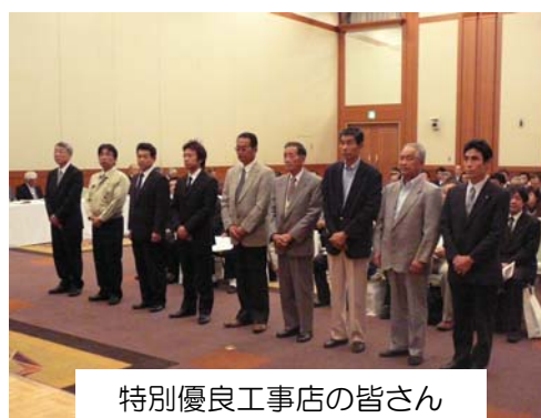
特別優良工事店の皆さん